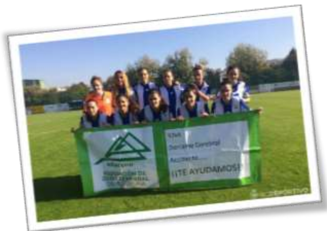
Homenaje del Dépor Femenino