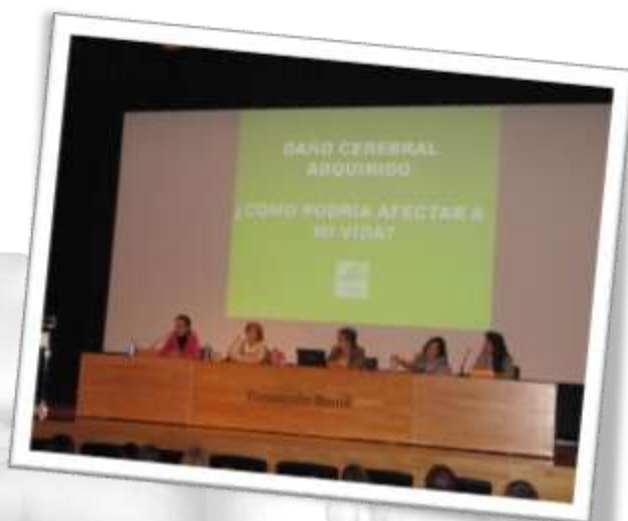
Charla sobre el DCA en la Fundación Barrié