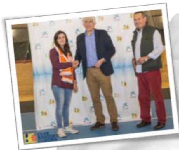
Salida al fútbol: Dépor-Valencia