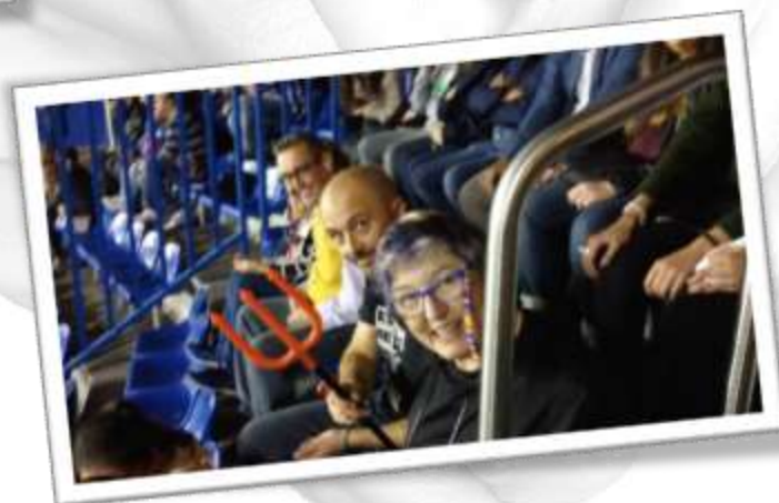
"Sin Cordura" en Os Mallos