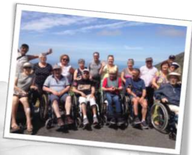
Excursión a Rianxo