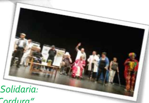
Gala Solidaria: "Sin Cordura"