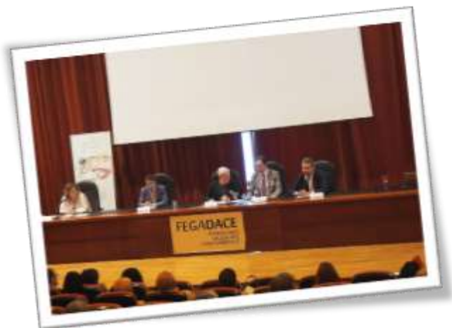
Foro de las Familias