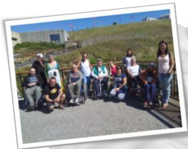
Visita a la casa de los Peces