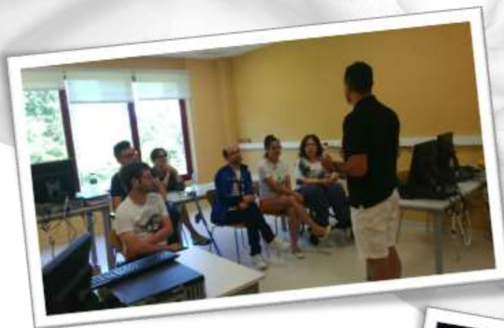
Visita al CAPD de Bergongo